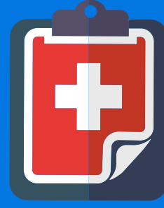
Póliza de salud